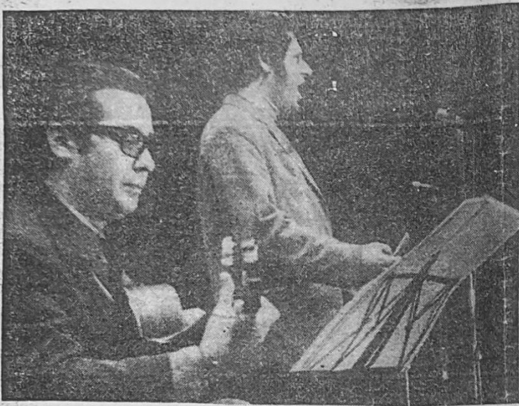
EL TENOR CHILENO, Hanns Stein, trae a Chile el mensaje de un gran músico alemán.