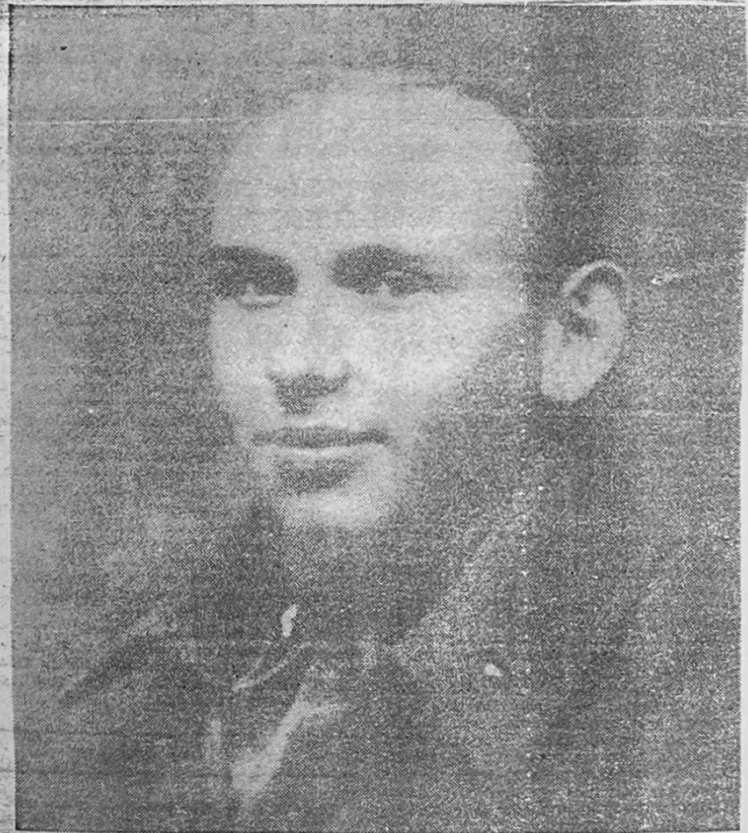
HANNS EISLER, joven, con su uniforme de soldado de la Primera Guerra Mundial.

Al mismo tiempo de ayudar a conocer más integralmente al músico-pensador revolucionario Eisler, este artículo aclara muchos conceptos en la discusión sobre política cultural en la presente etapa de la revolución chilena".