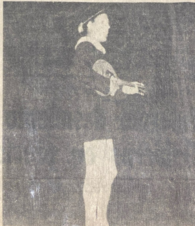
★ EL TENOR HANNS STEIN cantando en Florencia, durante la gira realizada por Italia.

Este es, en síntesis, el resultado de dos años de estada de Hanns Stein en Europa como becado del Gobierno de la R. S. de Checoslovaquia.