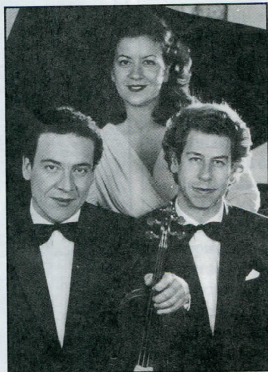
EL TRIO ARTE en la fotografía de la carátula de su primer disco,

caso del ya mencionado Guarello y el de Garrido-Lecca y tres obras de los compositores Ancarolla, Heinlein y Urrejola que fueron seleccionadas en el Concurso de Composición del Instituto de Música realizado en el presente año y convocado con motivo del aniversario del TRIO ARTE. Con respecto al concurso, nos comentan: «Haber participado en el concurso fue muy bueno...siempre nos han hecho falta tríos latinoamericanos... por ejemplo, en una ocasión en España, se nos solicitó un programa completo de obras latinoamericanas y tuvimos que completarlo con dúos y piano solo».